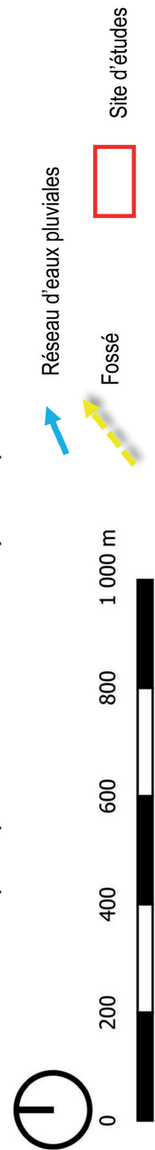
Figure 96 : Schéma de principe des réseaux et ouvrages structurant le réseau d'assainissement des eaux pluviales du site de La Janais - IAO SENN 2022